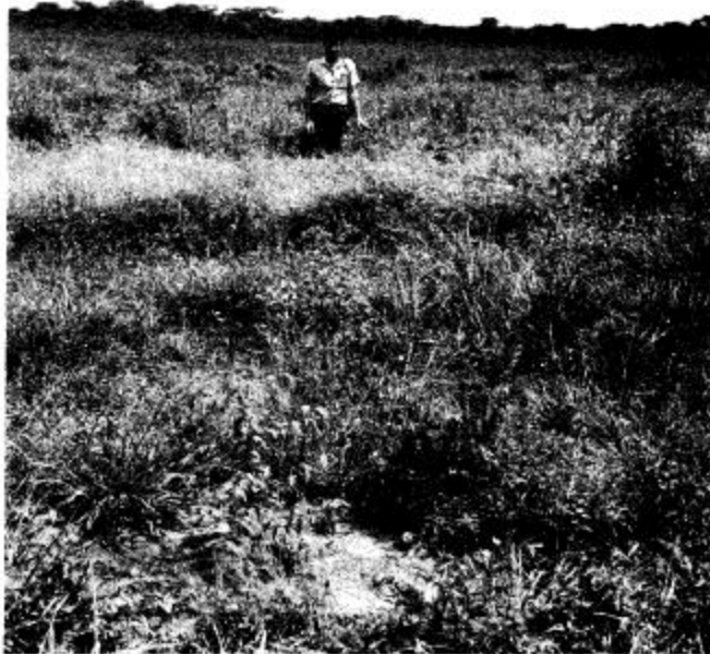
Figura 1 —Una plantación de Eucalyptus grandis de un mes de edad en el estado de Cojedes, Venezuela. Este potrero no inundable fue arado y rastrillado antes de la plantación. El crecimiento de los árboles es modesto, pero la competencia por pastos y malezas es abundante. B —Esta parcela adyacente a la anterior, fue encamellonada después de ser rastrillada. Los árboles, de un mes de edad, tienen más del doble de la altura de los de la figura 2A y la competencia por malezas es significativamente menor.