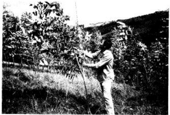
Figura 4A —Un ensayo de Eucalyptus globulus hecho por Smurfit Cartón de Colombia, S.A. Estos árboles fueron plantados en platos de 1 × 1 m, hechos con azadón en un potrero viejo con pasto kikuyu, su altura promedio es de 3,4 m al finalizar sus dos años. B —En una parcela adyacente a la anterior, en el mismo ensayo, se aplicó el herbicida glifosato (Roundup) al pasto antes de hacer la plantación y de nuevo a los siete meses de edad. La altura promedio de los árboles de bluegum eucalyptus es de 7,1 m al cumplir dos años.

Los pastos altos de las tierras bajas también compiten fuertemente con las plántulas. En Venezuela, en una plantación de Gmelina arborea de dos años de edad que fué establecida en un terreno con pasto guinea ( Panicum maximum ), la cual fué cortada dos veces después de la plantación, se obtuvo una altura promedio de aproximadamente 2,5 m, con una gran variabilidad en el crecimiento y baja sobrevivencia, mientras que, en una prueba vecina, en que se hizo un control manual continuo de la competencia, la altura fué de 7 m en promedio y hubo una buena sobrevivencia (observa-