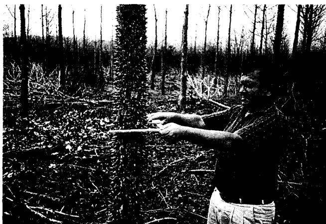
Figura 3 — Esta plantación de Bombacopsis quinata de ocho años de edad de Pizano, S.A., acabando de hacersele una entresaca. Los árboles en pie serán destinadas a la producción de láminas contrachapadas.

La especie Bombacopsis retoña bien y cuando se inserta una rama gruesa en el suelo húmedo, esta se enraiza. Gracias a que la Bombacopsis se enraiza fácilmente es apta para ser plantada en forma de estacas enraizadas, una vez que se haya mejorado genéticamente la cepa y ésta haya sido seleccionada y probada. En Centro América esta especie se considera como de los altiplanos secos, pero también puede crecer en tierras bajas, en las terrazas de los ríos, y en suelos húmedos durante la estación de lluvia y luego, soportar la sequía extrema de la estación seca en las plantaciones de la Costa none de Colombia (figura 3).